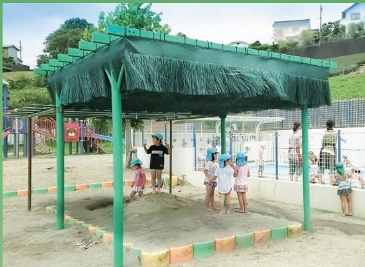
幼稚園、保育園の園庭、砂場、プールなどに。 木漏れ日に似た半日影とさわやかな音色も特徴です。

屋外休憩所・園庭・校庭・公園やイベント会場・アトリウムに癒やしの空間を。 強風、降雪に強いので農園芸の栽培現場にも最適です。