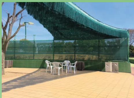
テニス・ゲートボール場の休憩所