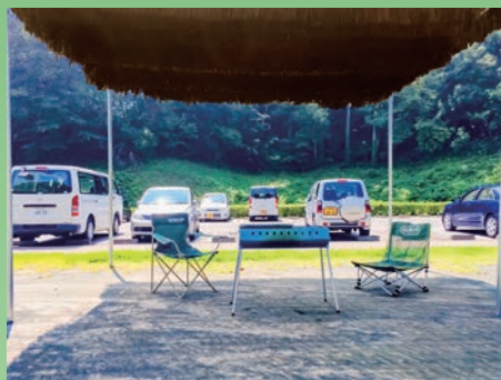
アウトドア・キャンプ場でも