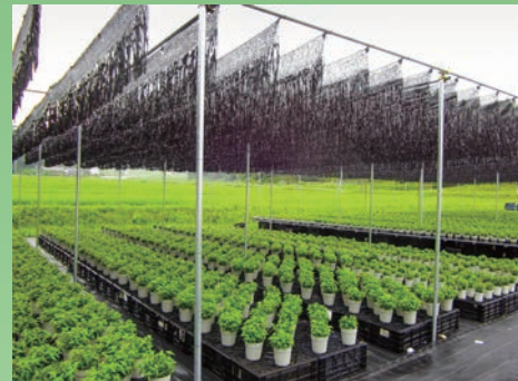
農園芸用途の遮光にも