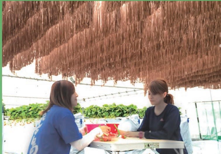
商業施設や観光農園の通路、休憩所などに。 景観に配慮した新色は、あらゆる場所に馴染みます。